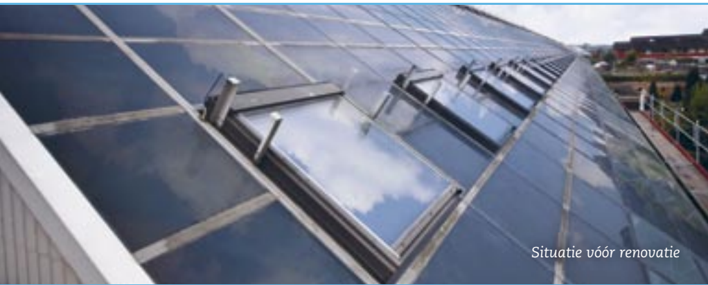
Situatie vóór renovatie