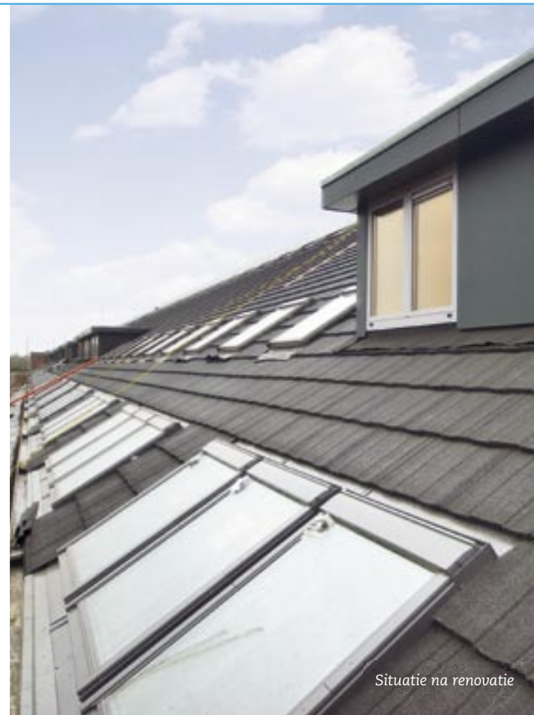
Situatie na renovatie

Alle 77 woningen (met een totaal dakoppervlak van zo'n 4.500 m 2 ) zijn inmiddels voorzien van MetroShake stalen dakpanelementen. Het resultaat: 'woningen met prachtige gerenoveerde daken die volledig bij de sfeer van de omgeving passen, uiteraard zonder lekkageproblemen', aldus een tevreden architect.